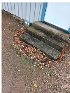
Kontrollpunkt 2 Gemensamma byggnaden.